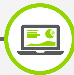
POWER IQ DCIM 軟體